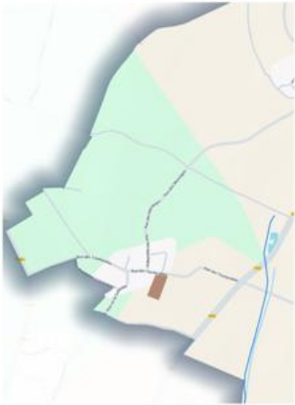
Localisation de la zone AU à l'échelle de la commune de Champagnolles