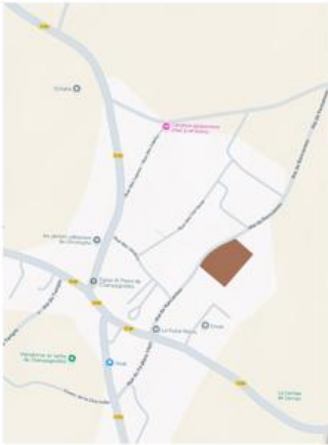
Localisation de la zone AU à l'échelle de la commune de Champagnolles