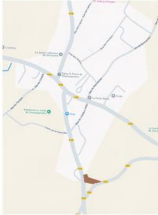
Localisation de la zone AU à l'échelle de la commune de Champagnolles